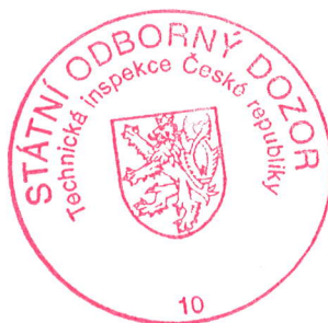
Ing. Tomáš Tůma technický náměstek

Toto osvědčení nahrazuje osvědčení ev. č. 1211/4/13/R-EZ-E1A